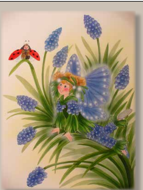
Illustration: Christl Vogl

Pärlhyacinterna är ett riktigt vårtecken. Fast de växer inte i naturen utan i våra trädgårdar. Nästan som en vindruvsklase, fast upp och ner liksom, växer de små himmelsblå eller vita pärlorna på sin stjälk. Och du, tittar du riktigt, riktigt noga, så kanske du kan se Fru nyckelpiga, när hon flyger omkring med sitt fina halsband