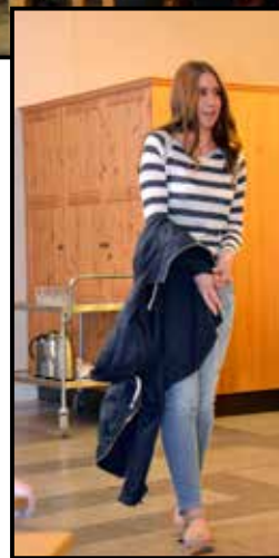
Vårens herr- och dammode, men även bröllopskläder presenterades vid modevisningen