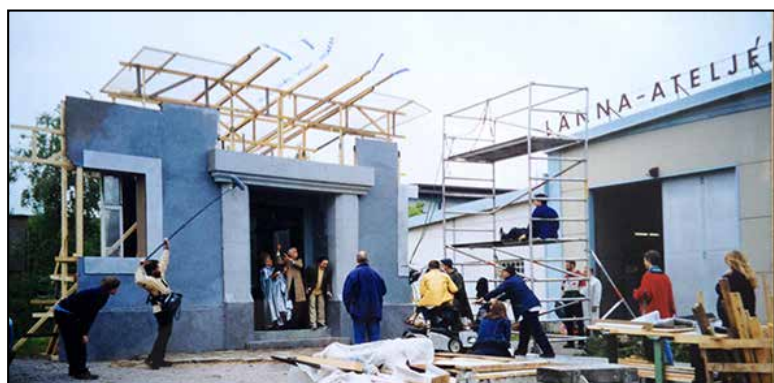
▲ Ateljébild från Hinden/Länna-ateljéerna.