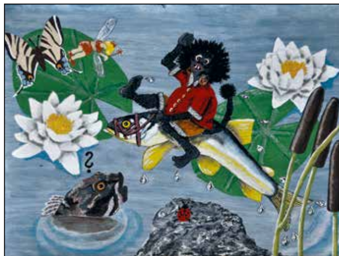
Illustration och text: Conny Molin

För att känna sig trygg bar jag Burra på rygg Vips så var han över allt som man behöver När hindren gör tvärstopp en vän som ställer upp