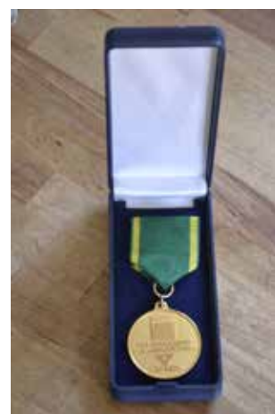
Medalj av ädlaste valör för leverans av högkvalitativ mjölk under 23 år.