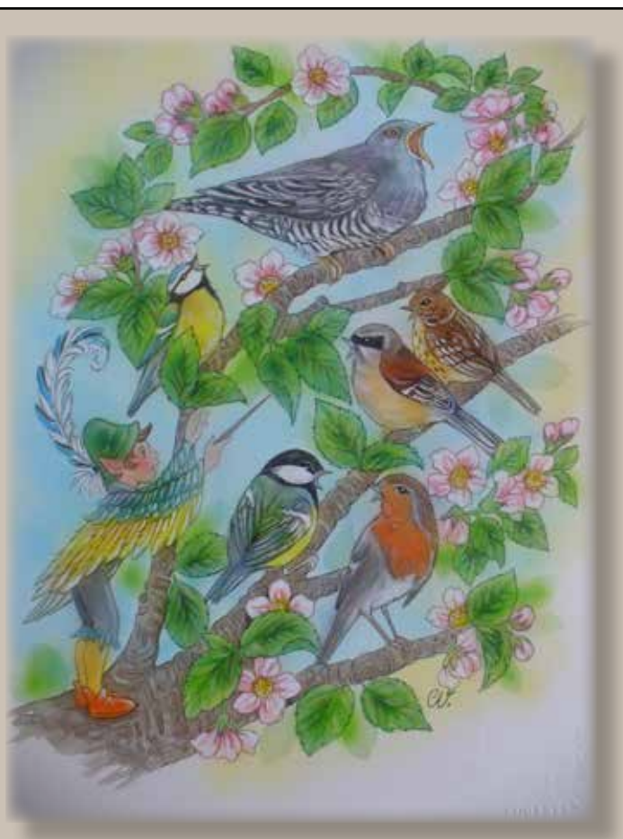
Illustration: Christl Vogl Text: Marianne Lundqvist

För Välkommen våren! med sin konsert de vill säga Och på den hälsningen vi väl alla vill heja Nu blir det sol och värme, roliga lekar och støj Nu väntar oss massor, massor, massor av skøj