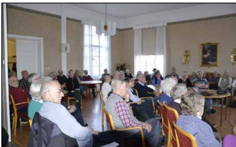
Stort intresse i Bergby, när enkäten om äldreboende i bygden presenterades.