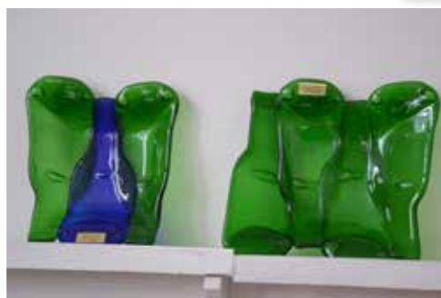
Glaskonst av Kerstin Rundlöf