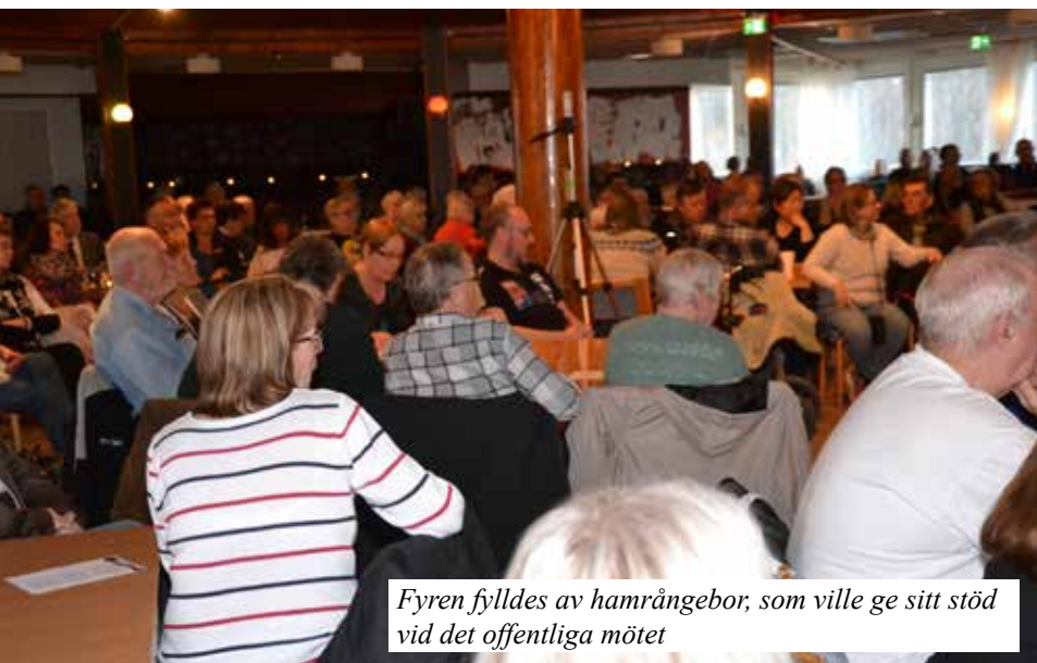
Fyren fylldes av hamrådebor, som ville ge sitt stöd vid det offentliga mötet