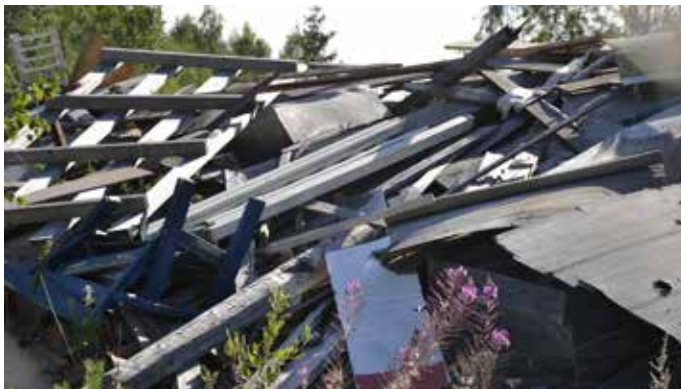
Mycket avfall och skräp har hamnat bakom betongfickor och stängsel. Men nu ska det bli bättring lovar Gästrike Återvinnare.