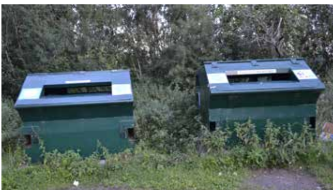
Brännässlor och tistel växer högt intill containrar vid återvinningsstationen i Hamrångefjärden...