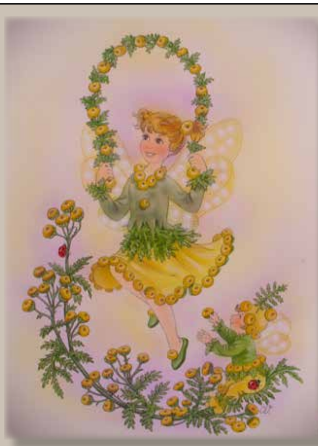
Illustration: Christl Vogl