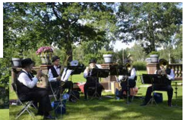
Självskrivet inslag under bruksdagen; Norrsundets brukssextett