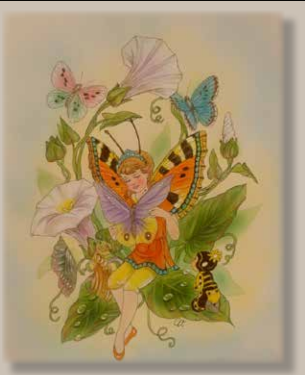
Illustration: Christl Vogl Text: Marianne Lundqvist

– Och jag lovar dig, det är alldeles, alldeles sant, hälsar fjärilsälvan.