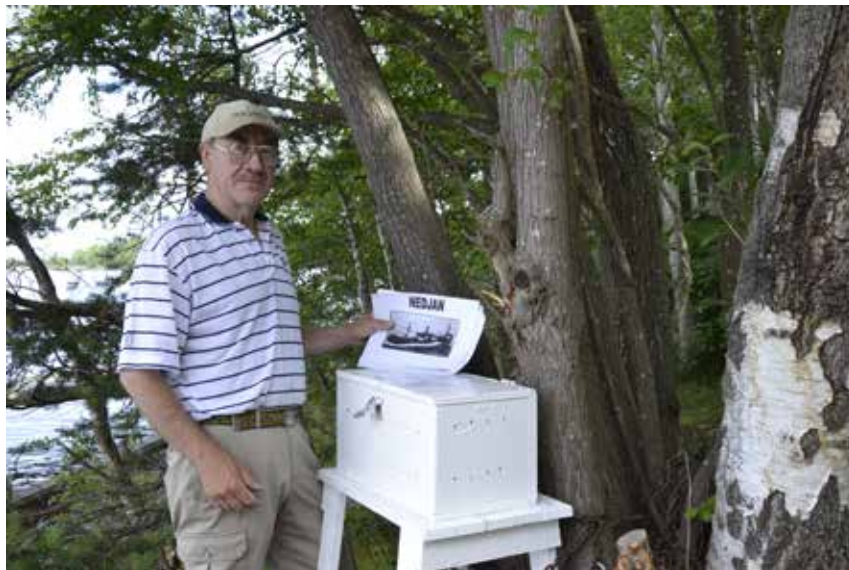
Pillan har sett till att hela historien om Nedjan nu finns att läsa intill minnesmärket vid pollare 4.

Er Installatör och Reparatör inom El i Hamrångebygden