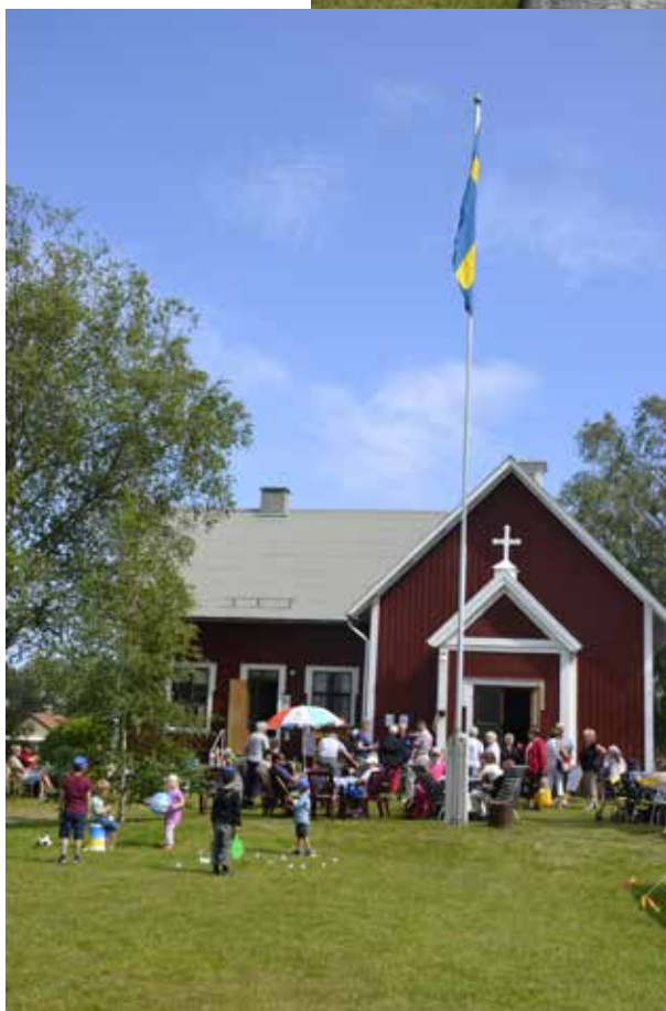
En avkopplande kaffestund eller lekar med loppisfynd – det bjuder Trödje bönhuscafé