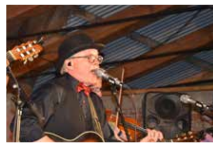
Östen med Resten drog fullt hus vid sitt framträdande