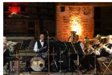
Norrsundets Bruksseptett spelade i Hyttan