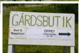
Fem marknadslördagar har det varit i Axmarbruk under sommaren