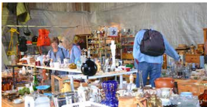
Loppisen vid Bönhuscaféet tilldrog sig stort intresse

Och joodå, besökarna kom som brukligt i stort antal till Bönhuscaféet i Trödje under de två veckor arrangemanget pågick. Lika brukligt var Hille Missionsförsamling arrangör.