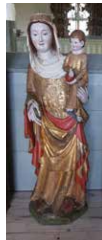
Maria med barnet är en av de skulpturer som nu renoverats