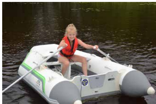
...och Amie gillade optimistjollen