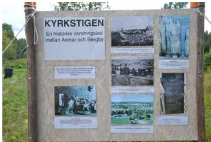
Kyrkstigens historia visas i ord och bild vid starten av leden i Axmarby

– Av den gästbok som finns i postlådan längs stigen, kan vi se att många redan i år hittat Kyrkstigen och tanken är att fotoklubben ska producera nya foton, där alla, både gamla och nya foton, sedan kan växla plats med varandra, berättar han.