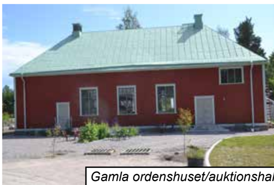
Gamla ordenshuset/auktionshallen i Axmarby genomgår en iögonfallande förvandling både exteriört och interiört