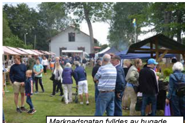
Marknadsgatan fylldes av hugade spekulanter