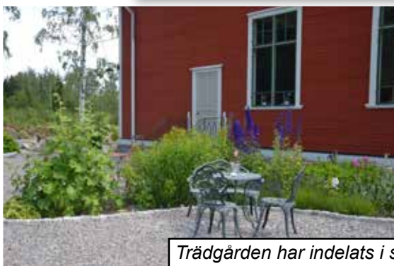
Trädgården har indelats i små trivsamma hörnor omgärdade av blommor