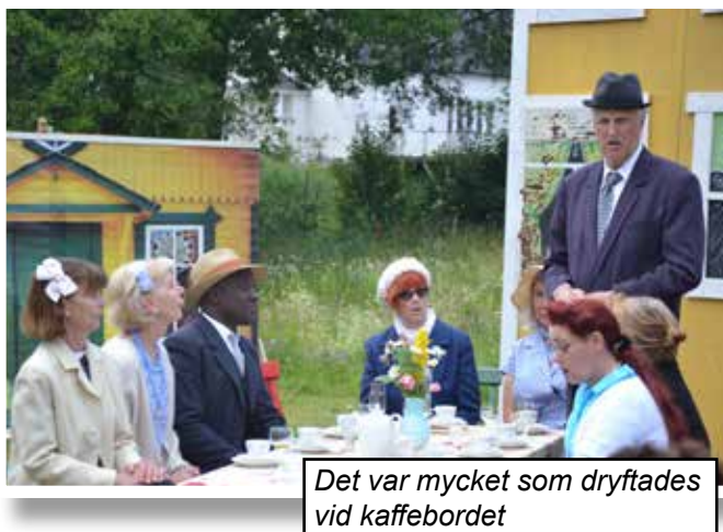
Det var mycket som dryftades vid kaffebordet