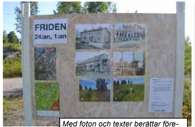
Med foton och texter berättar föreningen Rudan om Verket från förr