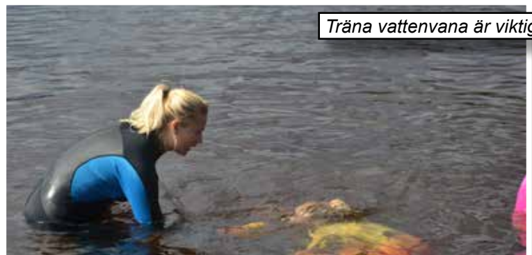
Träna vattenvana är viktigt