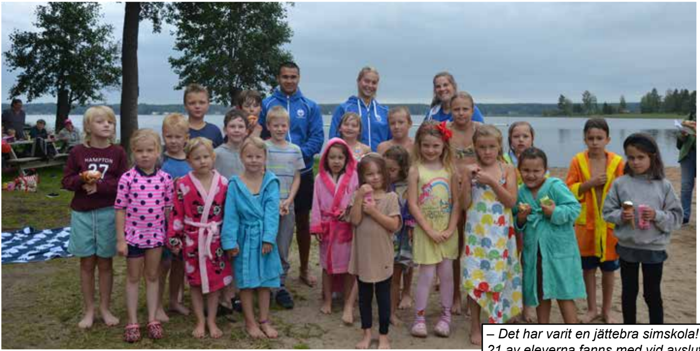
– Det har varit en jättebra simskola! 21 av eleverna fanns med vid avslutningen tillsammans med sina simlärare