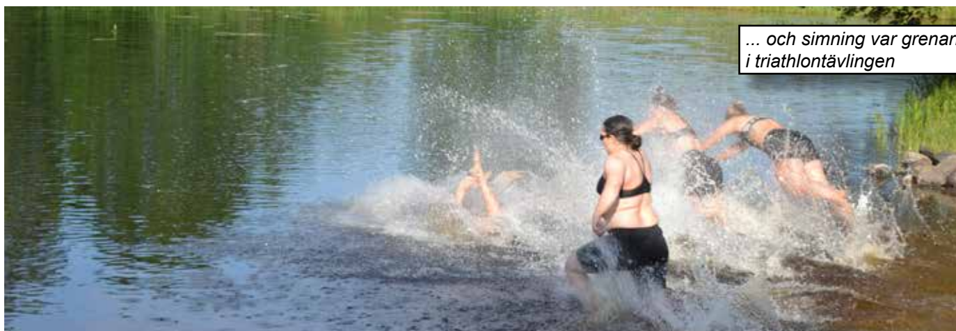
... och simning var grenarna i triathlontävlingen