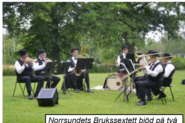
Norrunds Brukssextett bjöd på två konserter under dagen