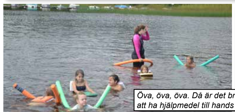
Öva, öva, öva. Då är det bra att ha hjälpmedel till hands