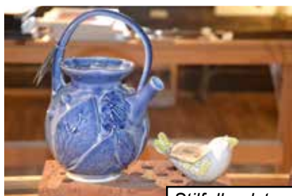
Stilfulla alster visades upp

Utställningen i Båthuset intill berättade om den spännande undervattensvärlden under ytan, där mötet mellan salt och sött skapat en speciell vegetation, men där också skeppsvrak och fynd berättar om järnbrukets 300-åriga historia. Effektfullt sammansatt i både ord och bild via Länsmuseet.