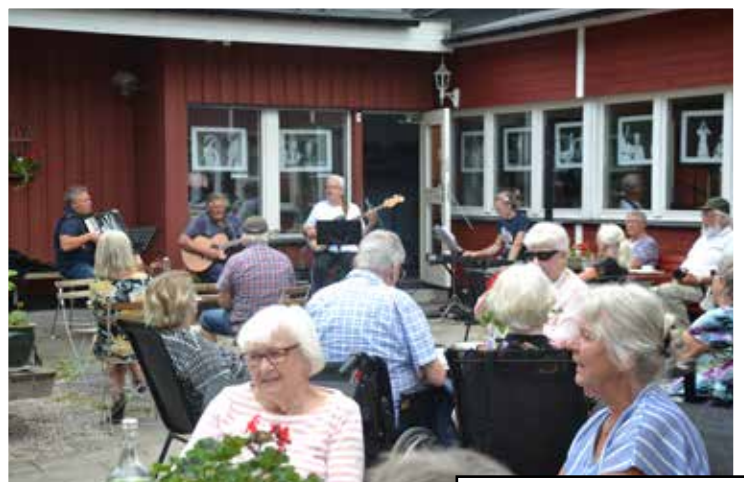
Coronaanpassat café i utemiljö vid Fyren