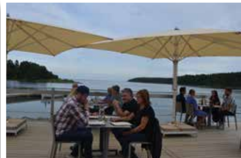
Maten kan gästerna njuta av med vacker utsikt över havet