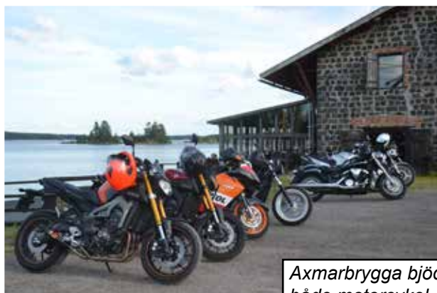
Axmarbrygga bjöd in både motorcykel- och bilentusiaster under juli

Även havskroger Axmarbrygga vittnar om en riktigt bra sommar, med många gäster och en välfylld husbilsamping. Under juli månad har dessutom inbjudits till bil- och mc-träffar, där alla gäster som kom i entusiastbil eller på mc bjöds på kaffe med chokladbit efter maten.