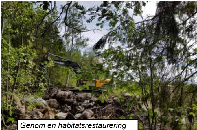
Genom en habitatsrestaurering skapas en ny fiskväg invid den tidigare pumpstationen i Norrsundet ...