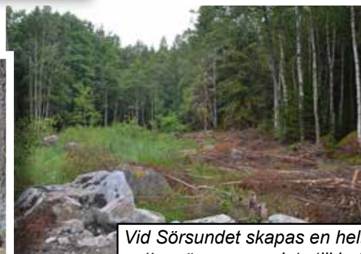
Vid Sörsundet skapas en helt ny vattenväg som ansluts till befintlig huvudfåra.