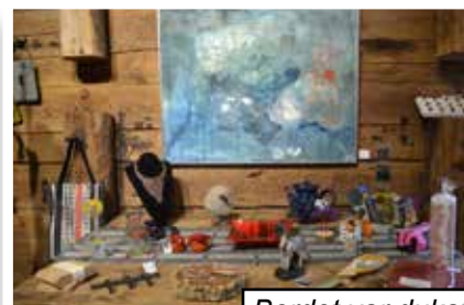
Bordet var dukat i Bläckhornet