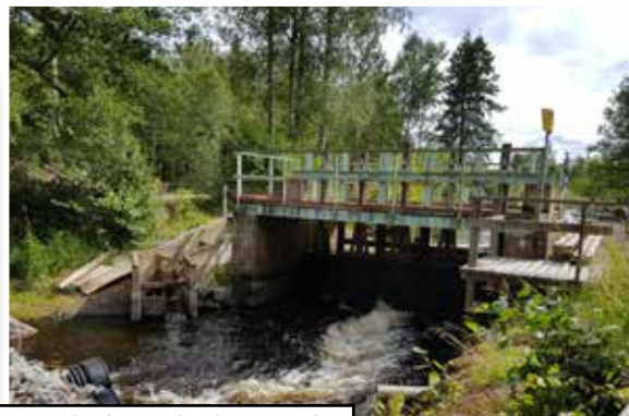
... och dammluckor med fiskväg blir ett minne blott