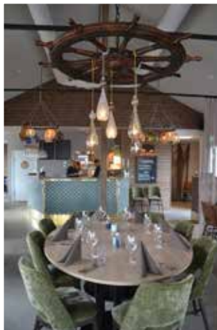
Stilfull interiör i restaurangen som i taket pryds av ratten från bogserbåten Björn

Från september dras restaurangens öppettider ner och hålls sedan stängd innan julbords-säsongen tar vid under november.