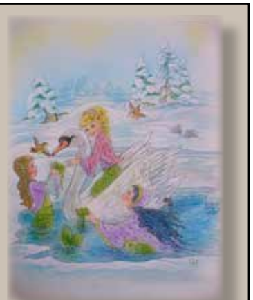
Illustration: Christl Vogl Text: Marianne Lundqvist

För se så är det må du tro och det är riktigt, riktigt bra Att verkliga vänner det är det bästa man kan ha De delar med sig av allt, när det känns mörkt och tungt Och snart kommer ju våren, så nu känns allting lugnt