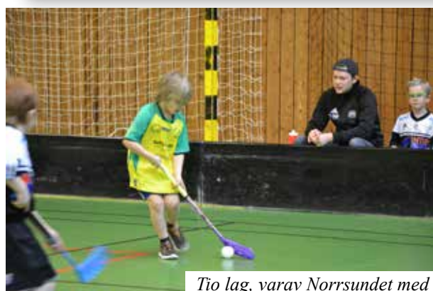
Tio lag, varav Norrsundet med två, deltog i innebandycupen i Norrsundets sporthall.