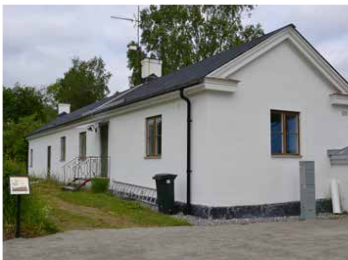
Med de beviljade projektmedlen kan nu planerna på ett trädgårdscafé och butik förverkligas i det f d orangeriet intill slottsparken.