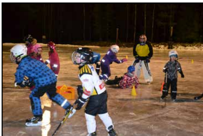
Nu har skridskoskolan startat hos Hamrångefjärdens IK

Skridskoskolan pågår varje onsdag mellan 18.00-19.00.