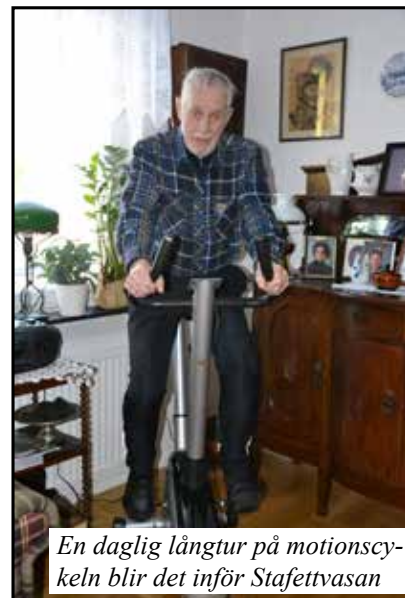
En daglig långtur på motionscykeln blir det inför Stafettvasan