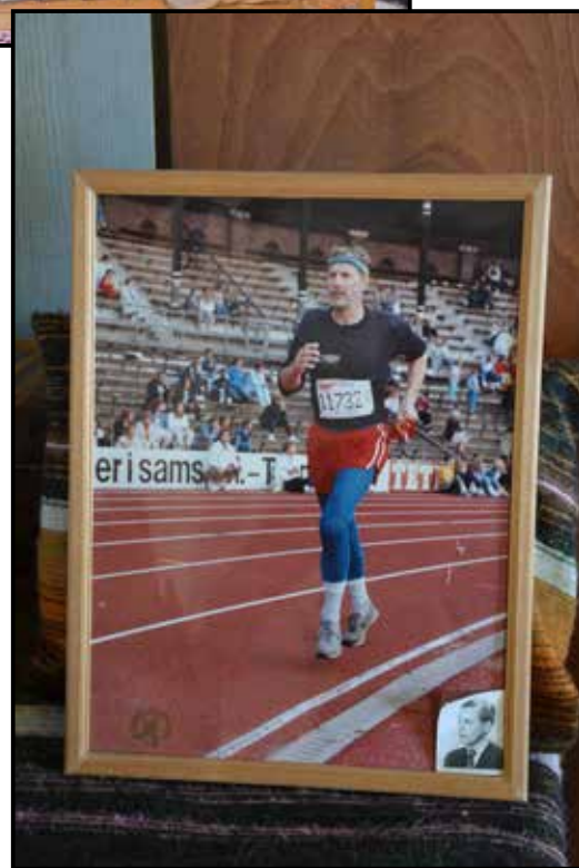
Stockholm Maraton 1984 var en av de största, men också mest minnesvärda utmaningarna.

sprungit Älvkarlebyrundan och HSK-löpet, deltagit i 24-timmars och Gavlemarschen och i Gästriketuren har han deltagit nio gånger. Hamrängemästare på skidor kan han ståta med och Lindölaggen åkte han flera gånger liksom Hälsingeleden under åren -81, -83 och -85.