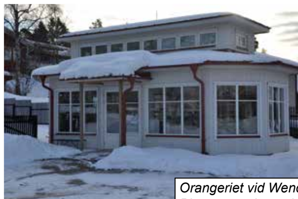
Orangeriet vid Wendins Blommor är byggt helt i Rossvallen Bygg AB:s regi