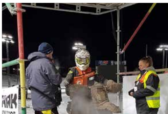
På väg ut i terrängen. Kallt, blött och lerigt, bara en del av den tuffa utmaningen.