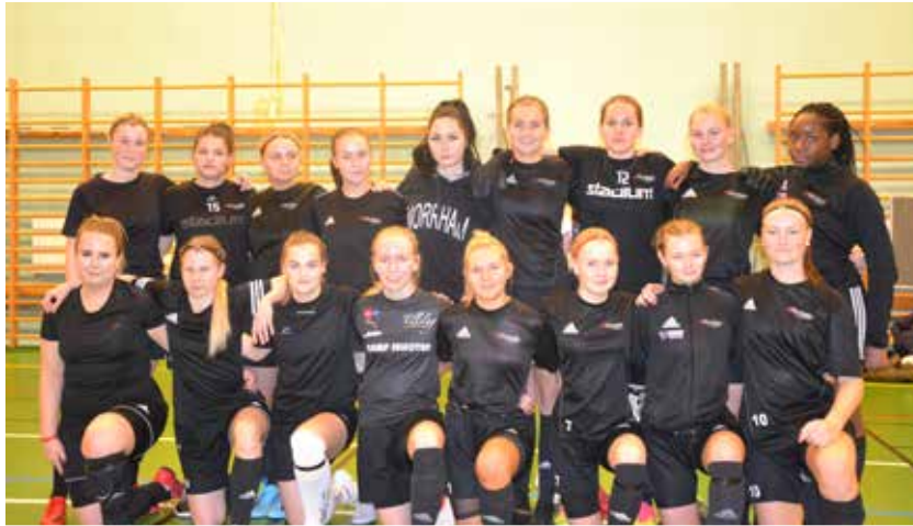
Norrhamns nybildade damlag har antagit utmaningen att spela i division II

när man kliver upp på seniornivå, så det bli en viktig uppgift att ta oss an, men som vi tror passar oss båda, säger de.