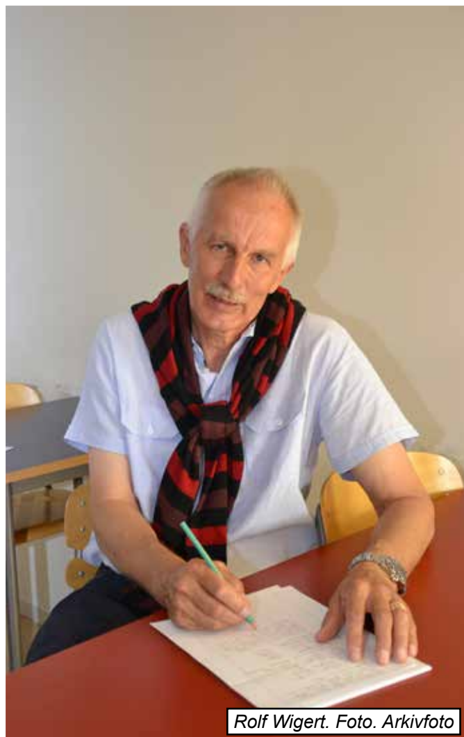
Rolf Wigert. Foto. Arkivfoto