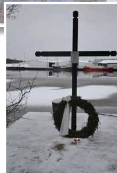
Nedlagd krans och tänd marschall vid minnesplatsen, där Nedjan låg förtöjd