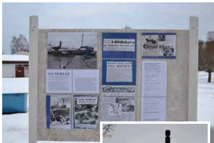
Invid Coop fanns en utställning om Nedjans öde

I samband med årets minnesdag hade föreningen också iordningsställt en utställning invid Coop med foton och tidningsurklipp om S/S Nedjan.