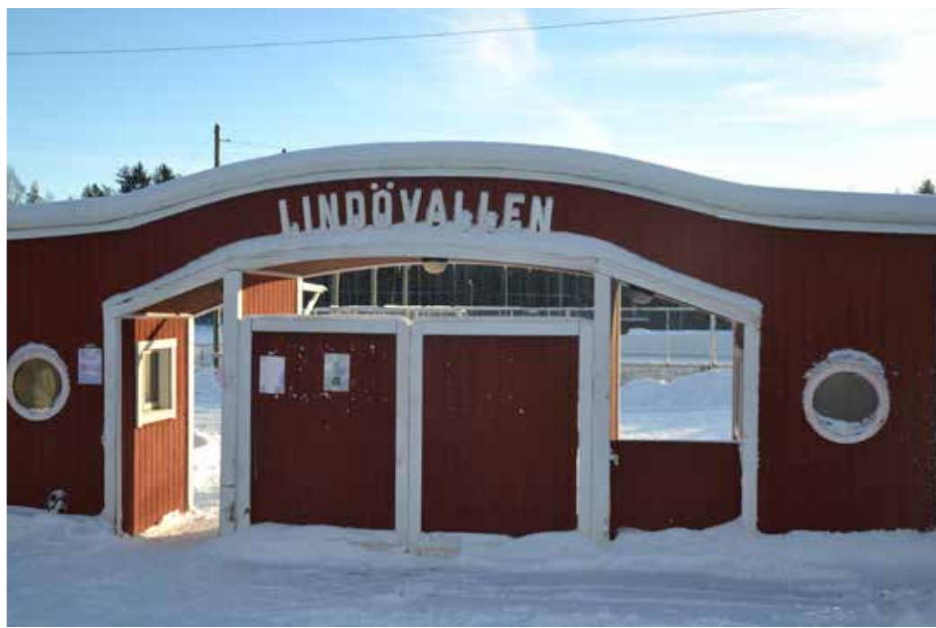
LindövalLENS is är öppen – men i dessa coronatider bara för medlemmarna

– Isen var jättefin, men tyvärr höll inte rinkens mått. Den har flera skador, vad de beror på vet vi inte, och en var rätt stor, så några träningsmatcher kunde det inte bli