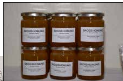
På hyllorna i gårdsbutiken