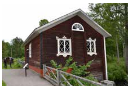
Kvarnen har genomgått en genuin hantverksrenovering

sig" först. Och all målning, den har bruksborna gjort själva. Föreningen får ett årligt skötselbidrag på 250 000 kronor till kulturresevatet, därtill kan riktade projektmedel sökas, men det är de ideella insatserna som möjliggör förvaltningen