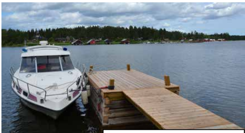
... och piren med stenkista. Lägg märke till "laxstjärtarna" i timringen.