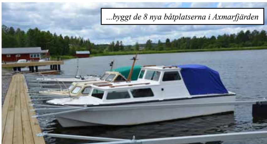
...byggt de 8 nya båtplatserna i Axmarfjärden