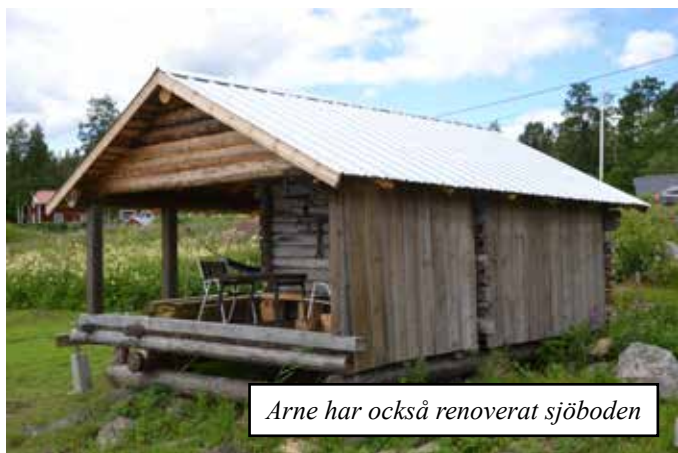
Arne har också renoverat sjöboden