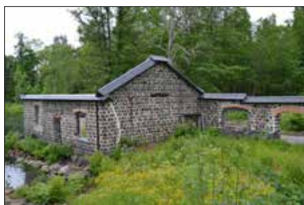
Resterna av spiksmedjan minner om tider som flytt