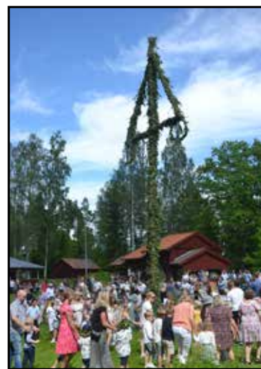
Text och foto: Marianne Lundqvist