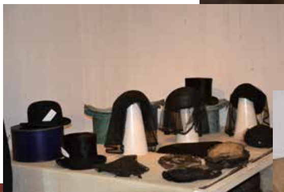
... och vernissage var det med utställningen Huvudsaken