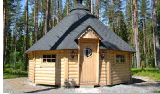
I kåtan tas älghundsägarna emot

kopplades in och när Petter visade upp filmsekvensen där älgarna står helt oberörda och tuggar i sig av maten trots en skällande hund på andra sidan stängslet, så konstaterades att idén inte bara var möjlig att genomföra utan också skulle vara effektiv.