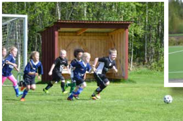
Ungdomsfotboll spelades hela dagen