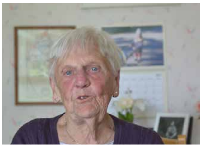
... Maj-san minns och berättar om tiden på 60-talet