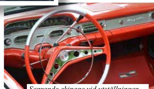
Segrande ekipage vid utställningen – Tage Gunnarssons Chevrolet Impala Cabriolet från -58