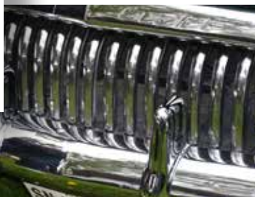
Svenne Axelssons Buick Rodmaster från -52 med helkromad instrumentbräda och grill