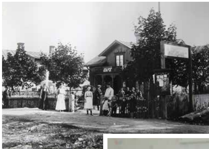
Norrsundets allra första café – Konsumbageriet på Rödbohar'n från 1908