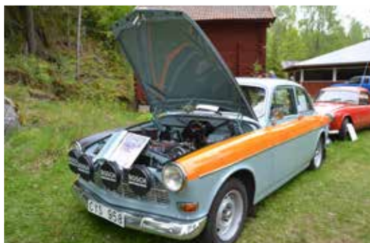
Bosse Lundkvists Amazon från -65 – en kopia av bilen han tävlade med under åren 1974-76