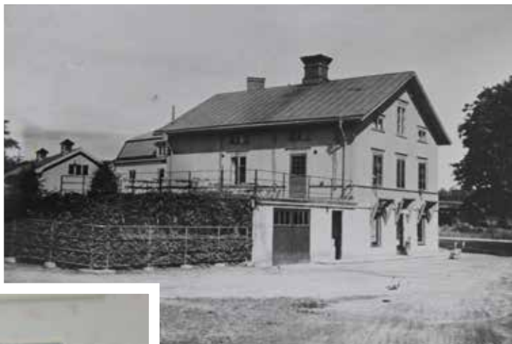
Caféet i centrum...