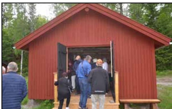
Många tog tillfället i akt att titta in båthuset, som invigdes i samband med nationaldagen.