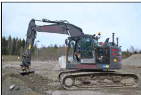
3000 kubikmeter moränmassa schaktades bort, innan ny bergkross fylldes på varefter området asfalterades.