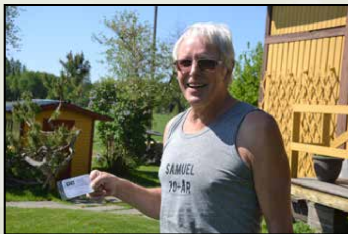
Frikort för all framtid fick han som avskedspresent