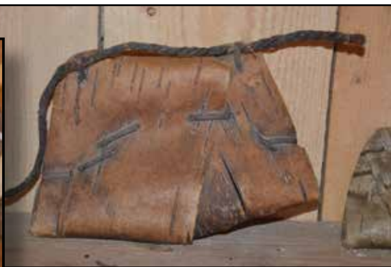
Båthuset rymmer inte bara båtar utan också foton, berättelser, redskap och föremål som hörde gårdagens fiske till.