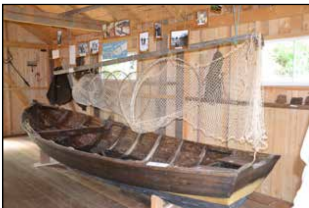
Lillbåten, som byggdes i Uttervikarna på 1950-talet