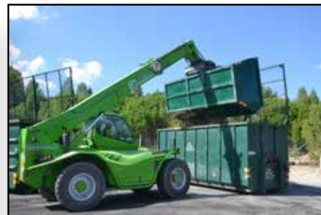
Återvinningscentralen har fått ett nytt containersystem som hanteras med lastmaskin

Cirka 3000 m 3 moränmassor har schaktats bort, ny bergkross fyllts på och därefter har ytan asfalterats. Istället för de tidigare betongfickorna finns nu uppmärkta containrar placerade längs sidorna som, allteftersom de fylls, fraktas bort och töms i en större container för att sedan ställas tillbaka på plats igen. Det och att belysningsstolparna har flyttats har frigjort yta för kunderna, som nu enkelt kan köra fram till den container de ska lämna sitt avfall i. Även om det förstås fortsättningsvis är en klar fördel om avfallet sorterats innan avlämning för att minimera köbildning.