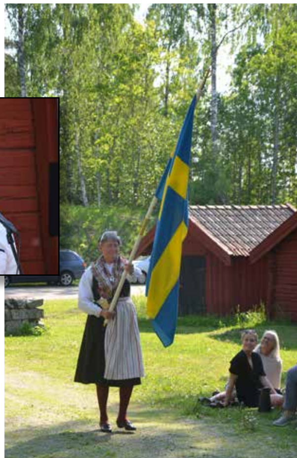
Nationaldagen firades traditionsenligt på hem- bygdsgården