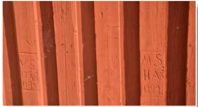
VS 13 år 1949 och MS 11 år 1949 står inristat i väggen på byggnaden bakom Hedenstugan

Pengar var en bristvara och var det något de ville ha, så fick de se till att ordna det själva.