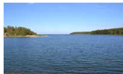
Restaurangen ligger med häfnörrande utsikt mot öppet hav