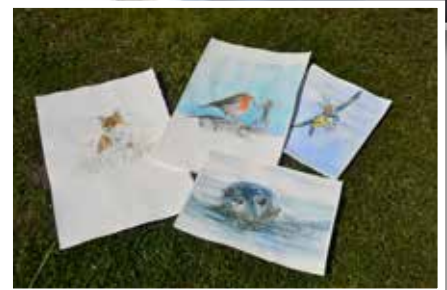
Några av hennes akvarellmålningar som också finns med vid utställningen