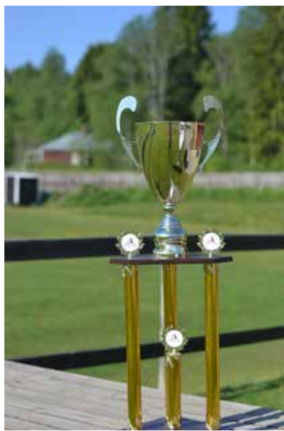
... även vandringspriset som Årets säljare i UF Gävleborg

– Tjänsten jag erbjuder innefattar säljmaterial, säljtips och kaffepaket, där idrottslagen även har möjlighet att få sin logotype på påsen, som kaffepaketet levereras i och leveransen till idrottslagen sker i miljöbilar från Bilmetro i Gävle.