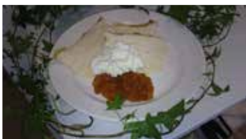
Delikat ostkaka från Häcklegård

Största delen går till mejeriet, men en del av mjölken stannar på gården och blir till verklig kulturmat som kalvdans, ostkaka och koost och sedan säljs hos Hamrångebygdens Delikatesser.