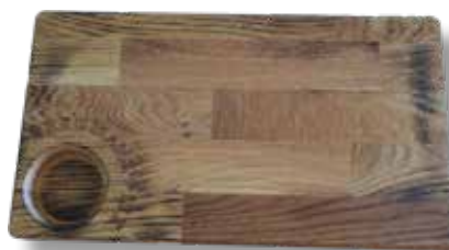
Flera av maträtterna kommer att serveras på ekplanka å la Johan Berg