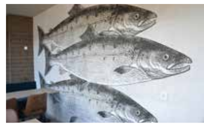
Med rätta associationer. Tapet på en av väggarna.