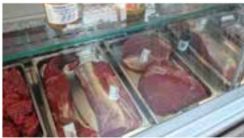
Nötkött i variation från Häcklegård