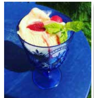
Mmmm... Lokalproducerad glass från Hådellgården