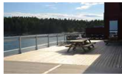
Verandan med plats för 150 gäster har höj- och sänkbara glasväggar