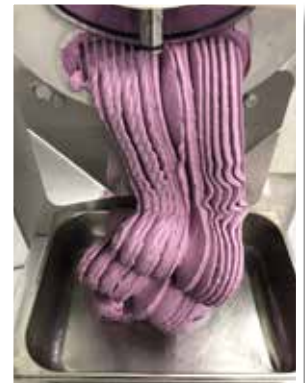
Blåbärglass var det här!

– Och lite kuriosita är det allt att vi fick leverera glass till ett bröllop i Åmot, efter önskemål från brudparet, som kom ända från Chicago, tillägger de.