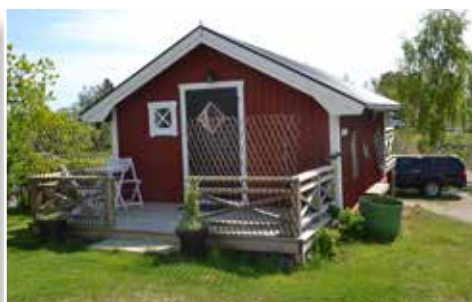
Utöver café och fiskbutik har Håkan och Margareta uthyrning av stugor