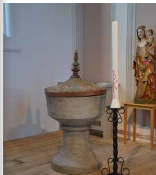
Ny plats för dopfunten och dopgäster