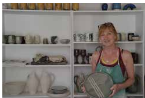
Med inspiration från Skatudden. Alster med björktema och på hyllorna muggar med Haikutexter.