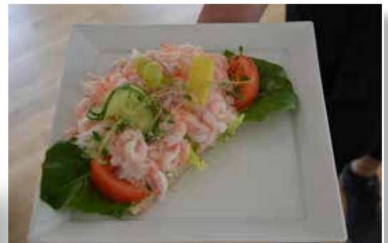
En favorit - Lyxräkmackan