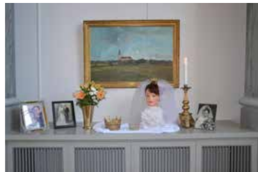
Församlingens brudkronor visas upp