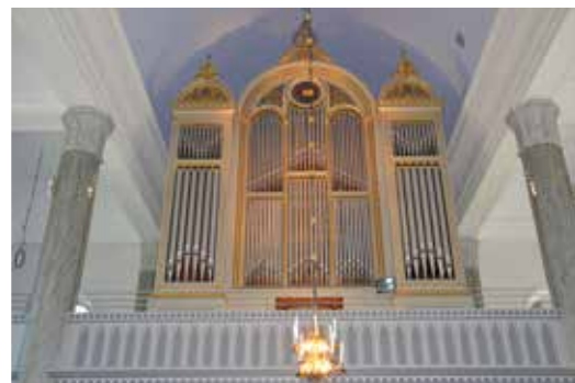
Nu syns kyrkorgeln