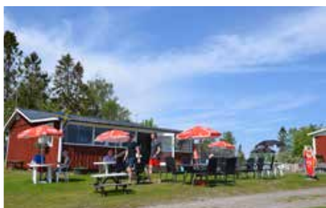
Sommarcaféet är pittoreskt inbäddat bland röda stugor och gröna björkar