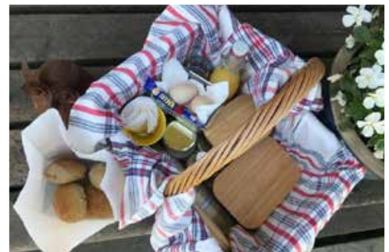
En välfylld frukostkorg väntar på trappan, när gästerna vaknar