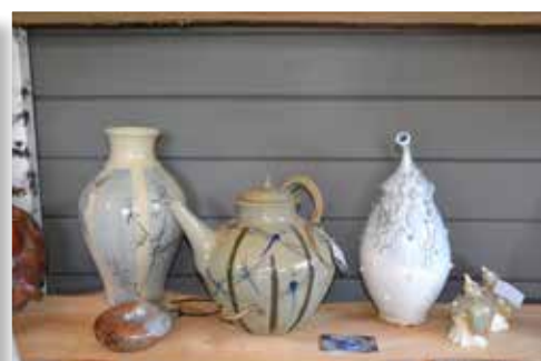
Åsa har producerat en stor variation av keramik till sitt galleri