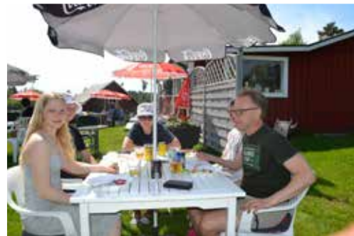
Familjen Hellsin från Gävle men sommarboende i Gåsholma njuter av delikatesserna vid sommarcaféet

– Det var en uppskattad aktivitet, som vi nu återkommer med.