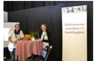
Leader Gästrikbygden, med kontor i Bergby, presenterades tillsammans med Leaderprojektet Omställning i praktiken