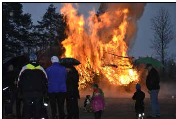
Stor valborgsmässoeld brann vid Hamrådefjärdens IP sista april

Hamrådefjärdens IK:s valborgsmässoeld brukar locka en stor tillströmning av besökare, både unga och gamla, och många var det även i år som trotsade kyla och regn för att välkomna våren med värmande brasa. Generös fiskdamm för barnen, korv och hamburgare på menyn, öppen cafeteria och stort fyrverkeri därtill bidrog till att förstärka traditionen med valborgsmässofirande på Hamrådefjärdens IP.