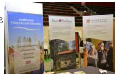
Knutpunkten Landsbygdscenter och Hamrånge Företagarförening hade egen monter vid Landsbygdsriksdagen