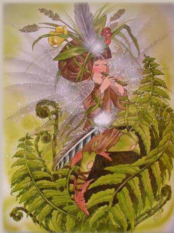
Illustration: Christl Vogl

Och alldeles snart tror jag det kommer fler och fler små ormbunkestjälkar upp ur jorden. Då är det bäst att Ormbunksälvan håller sig framme med sin flöjt och spelar lika vackert igen, så de fina, gröna bladen blir lika stora på allihop. Tycker inte du det också?