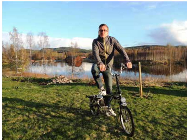
Projektet Benelux bed and bike pågår nu i Hamrångebygden med målsättning att locka cykelturister från Beneluxländerna.