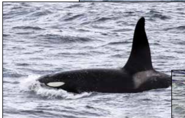
Valar och späckhuggare kan ses vid safariturerna