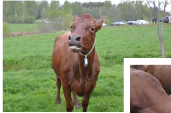
Muuuuuusigt att äntligen få komma ut.