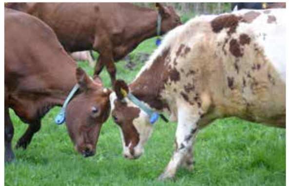
Ut i det fria – leka och stängas