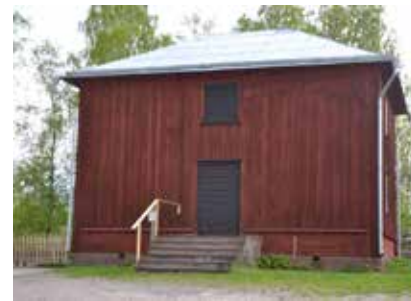
Främsta uppgiften för Jordägarkassan är att förvalta sockenmagasinet från 1758, men utrymme finns också för viss anslagsverksamhet.

Hamrånge Jordägares kassa hade sedan bildandet förvaltats under Hamrånge Hushållsgille, men då sammanslagning av gillen inom Dalarna-Gävleborg skulle genomföras beslutades 2007 att en fristående förening att förvalta kassans medel skulle bildas för att säkerställa att medlen stannade i Hamrånge. I samband därmed beslutades också att Maskinkassan skulle avvecklas eftersom värdet i densamma urholkats i förhållande till rådande maskinpriser och att den inte heller längre var förenlig med kassans stadgar.