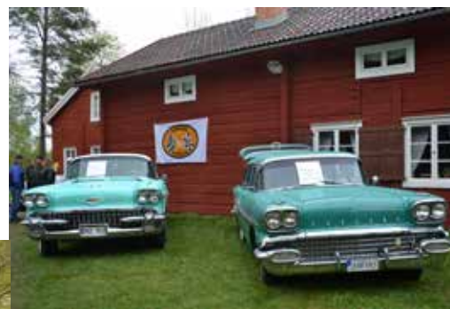
Två pärlor bredvid varandra; En Cadillac De Ville och en Pontiac Star Chef Custom Safari