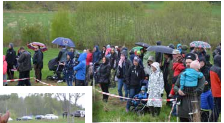
Kosläpp vid Häcklegård har blivit något av en attraktion i bygden

Det årliga kosläppet har växt till en verklig attraktion och bilar stod parkerade längs en kilometerlång sträcka efter Häckelsängsvägen. Utöver de våra kossorna kunde barnen också titta på småkalvar, det fanns ostkaka, gjord på Häcklegårdskossornas mjölk, att köpa, liksom en del andra lokalproducerade varor.