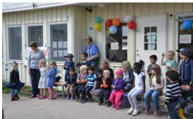
Tårtkalaset inleddes med att alla barnen bjöd på glada sånger

Alla Tider's har utan framgång sökt Gavlegårdarna för uppgifter om några konkreta planer finns över vad som sedan ska hända med Bergbackagårdens lokaler.