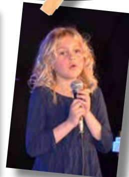
...och Thea fram- förde en alldeles egen låt