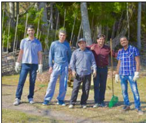
Flera asylsökande deltar vid arbetsdagarna på hembygdsgården – tar samtidigt del av svenska språket