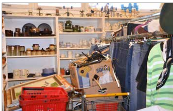
Nerpackningen har börjat, men ännu återstår en hel del arbete innan allt kan köras in till Röda Korset på Brynäs.

Sina expeditions- och loppislokaler i Fyren säger de nu upp och hoppas få byta till mindre lokalyta med hyresnivå anpassad till den nya och mindre verksamheten.