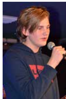
Maximilian sjöng Ho hey