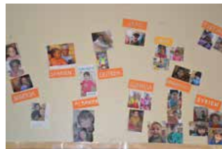
Barn från många olika länder har deltagit i Bergbackagårdens förskoleverksamhet sedan nyanlända började komma till Norrsundet 2013.