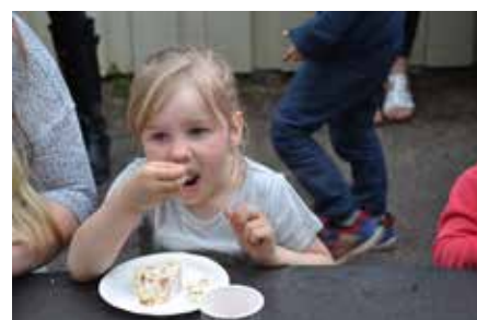
... Joline lät sig väl smaka