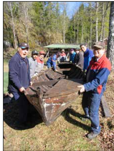
Med gemensamma krafter dras båten på plats till båthuset

I år börjar också medel ur Minnesfonden att användas för iordningsställande av ett arkiv på hembygdsgården. Allt arkivmaterial har hittills förvarats på annat håll, därmed svårt att studera, och därför planeras nu en ombyggnad av hembygdsgårdens mangelbod till ett arkiv så att intresserade på plats kan lära mer om bygdens historia.