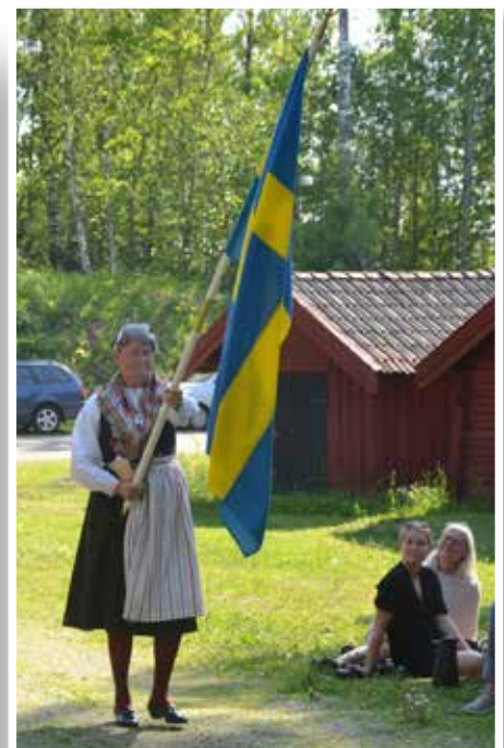
Det blir inget midsommarfirande vid hembygdsgården i år ... och inget nationaldagsfirande