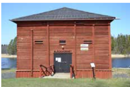
Bläckhornet fylls även i sommar av konst och konsthantverk