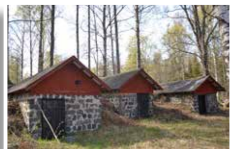
Mycket från den gamla bruksmiljön är bevarat