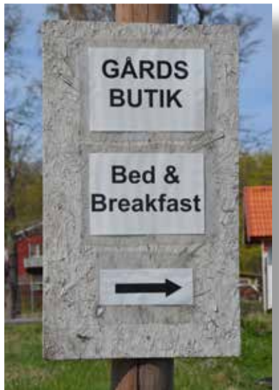
Text : Marianne Lundqvist

Axmar Bruksbod Bed & Breakfast erbjuder flera paketresor med upplevelser i Axmar bruk i samarbete med bokningsföretaget VisitTo.