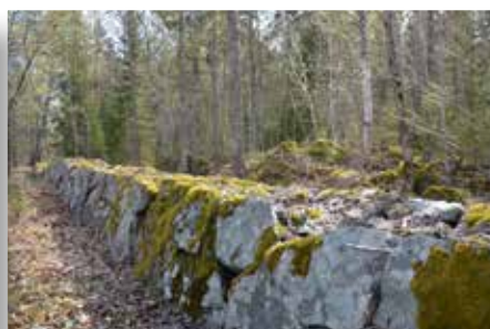
En kilometer lång är stenmuren, som sträcker sig runt hela parkområdet i Axmarbruk