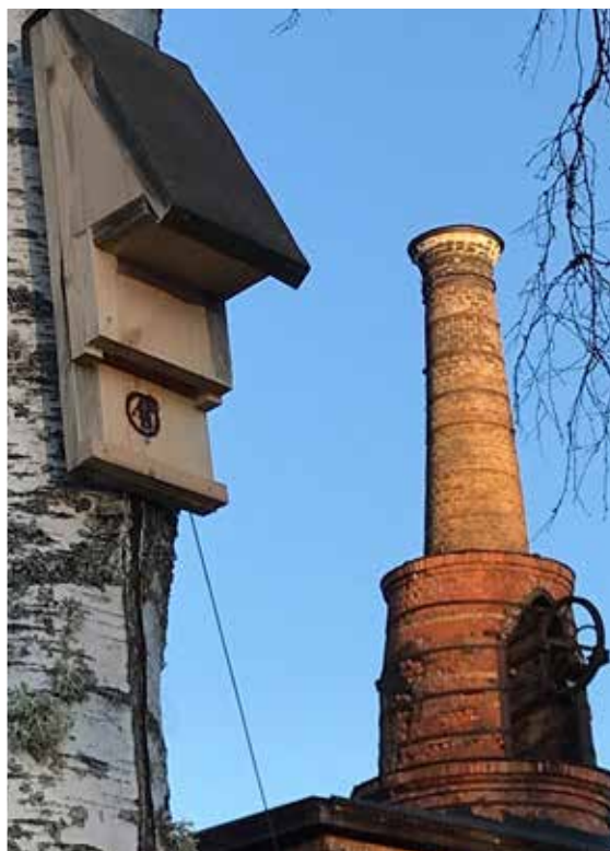
Holk för fladdermöss

– Familjevis och med nödvändig utrustning jag tillhandahåller kan de också följa med till en