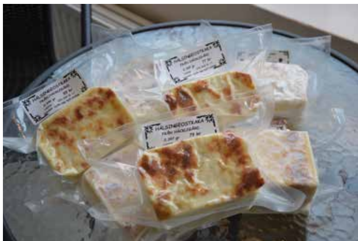
Ostkakan från Häcklegård satte Hamrånge på kartan vid Ostfestivalen på Nordiska Museet i Stockholm

tidningen Vin- & Matguiden, som sedan lyft fram ostkakan från Häcklegård tillsammans med ett passande vin.