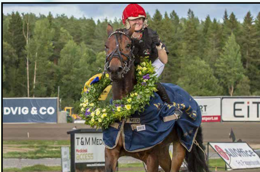
Sejer i montétävling vid Hagmyren i augusti 2020.