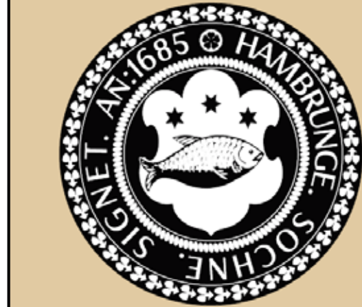
Så här kommer fasadflaggorna med sockensigill att se ut.

Båda projekten sändes vidare till Hamrånge-Rådet för beslut, som tillstyrkte ansökningarna. De går nu vidare till Gävle kommun Jörgen Edsvik/Erik Holmestig för slutgiltigt beslut.