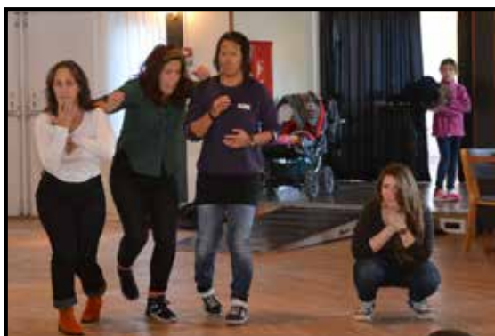
Communitygruppen Freedom Theatre från Palestina anordnade workshops