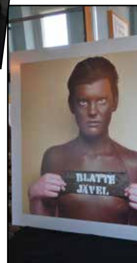
Fotografen Elisabeth Ohlson-Wallin ställde ut i Kastellet