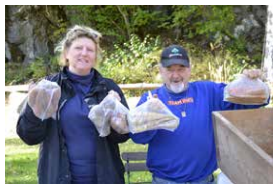
Lokalproducerade rotfrukter vid LRFs stand