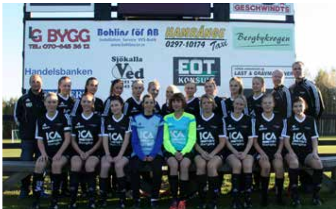
Norrhams damlag tar steget upp i division 2.

En bragd utöver det vanliga har NorrHams damlag stått för under säsongen. För första gången någonsin har nämligen ett fotbollslag från bygden tagit steget från division 3 till division 2.