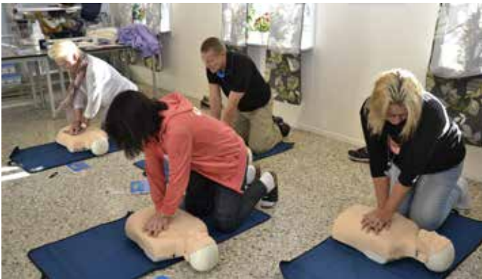
Personal i bägge butikerna har fått utbildning i hjärt- lung räddning och hur hjärtstartarna ska användas. I Norrsundet hölls den i Konsums lokaler.