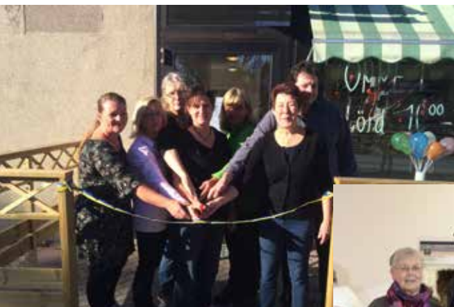
Lokalproducenterna klippte det blågula bandet när produktionsköket Hamrångebygdens delikatesser invigdes.