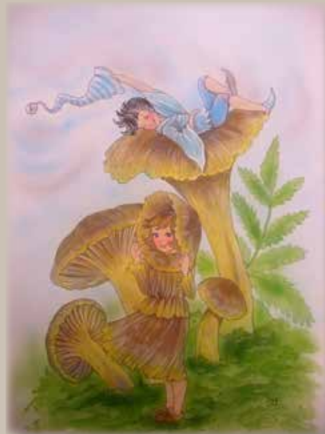
Illustration: Christl Vogl Text: Marianne Lundqvist