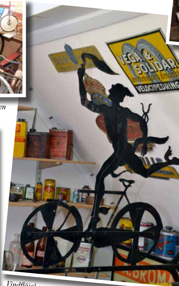
Vindflöjel associerande till cykelmärket Hermes, symboliserat av Idrottens gud med samma namn.