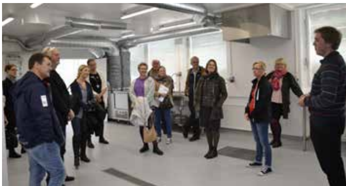
Deltagare i Partnerskapet för länets landsbygdsprogram 2014-2020 gjorde ett studiebesök i produktionsköket.