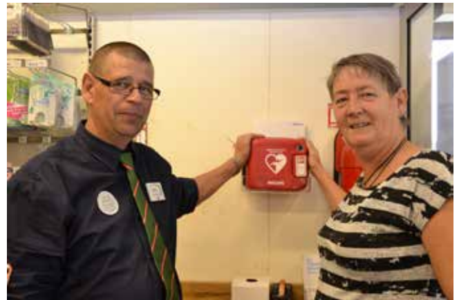
Konsum i Norrsundet