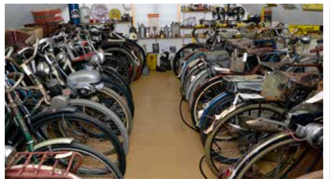
Påhängsmotorer har Per-Arne fixat till över 30 olika cyklar.