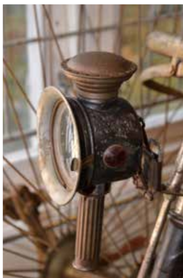
Lykta med plats för stearinljus