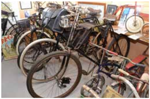
Den främre vuxencykeln är en upp- och nertrampcykel