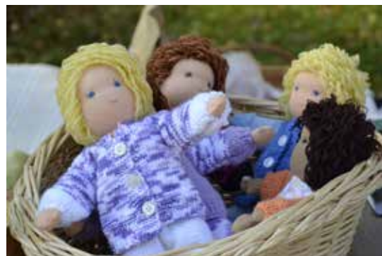
Berit Olssons färgglada Walldorffdockor

Höstmarknaden blev också avslutning för sommarens utställning Se hur Norrsundet växte.