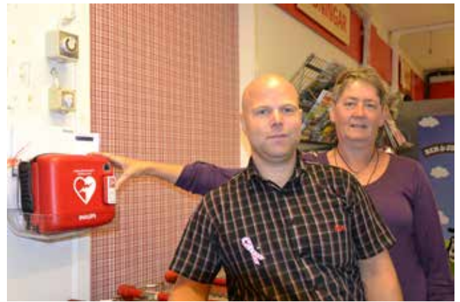
Hjärtstartarna på plats hos ICA i Bergby och