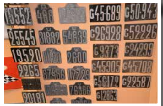
Nummerskyltar krävdes för cyklar ända in på 40-talet.