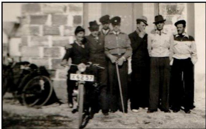
Ett gäng grabbar utanför Idrottscaféet 1937. Känns de igen?