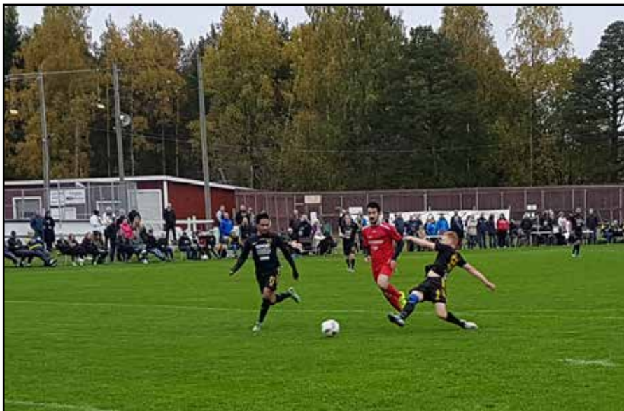
7-0 blev segersiffrorna i matchen som lyfte NIF upp till division IV inför nästa säsong.

Så säkra på seger och avancemang var några av NIF:s supportrar att de hade ordnat med både guldhattar och T-shirts med segertext.