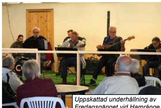
Uppskattad underhållning av Fredagsgänget vid Hamrånge PROs träff på hembygdsgården.

Den 10 september lyckades vi få till en träff med våra pensionärer på hembygdsgårdens danspaviljong. Det bjöds på musik av den eminenta orkestern Fredagsgänget och träffen blev ett skönt avbrott i det begränsade utbudet av aktiviteter inom PRO Hamrånge i Coronatider. Det känns verkligen bra att hembygdsföreningen upplåtit dansbanan och möjliggjort utomhusmöten i bygden. Vi hoppas förstås också att vi får njuta av Fredagsgänget även i framtiden, då Covid 19 är ett minne blott.