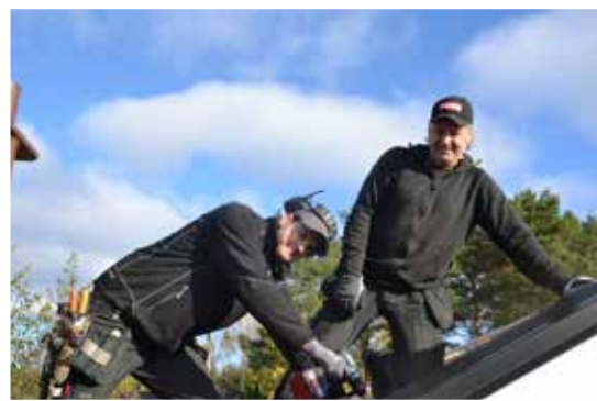
Som plåtslagare får man inte vara höjdrädd. Takläggning är bland de vanligaste jobben.