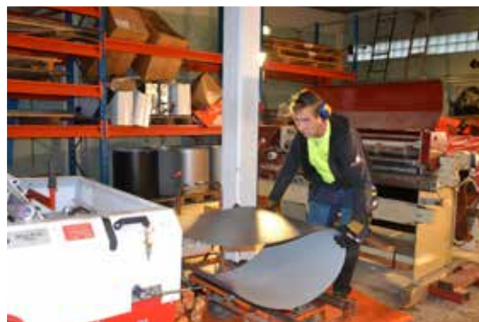
Dubbelfalsad bandtäckning. Plåtarna ska till ett fritidshus på Blidö utanför Norrtälje

- Tidigare låg jobben till 70 procent på företag och 30 på privatsidan, nu är det tvärtom.