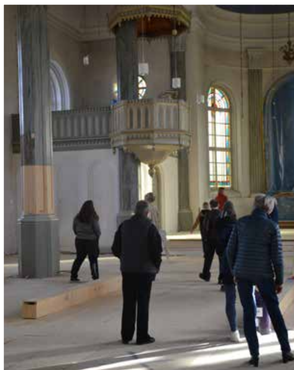
Tomt på inventarier i kyrkan, men predikstolen har fått sin nya och ursprungliga plats