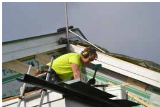
Sonny fixar nytt tak vid ett fritidshus i Axmarby