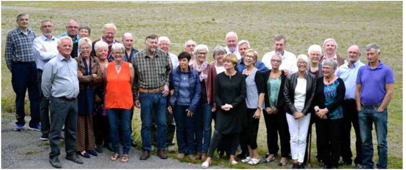
28 av eleverna årskullarna 45:or till 49:or vid Råns skola möttes vid skolträffen i HIK-lokalen. Många har blivit hembygden trogen, men kom gjorde de också från Jönköping i söder till Bollnäs i norr.