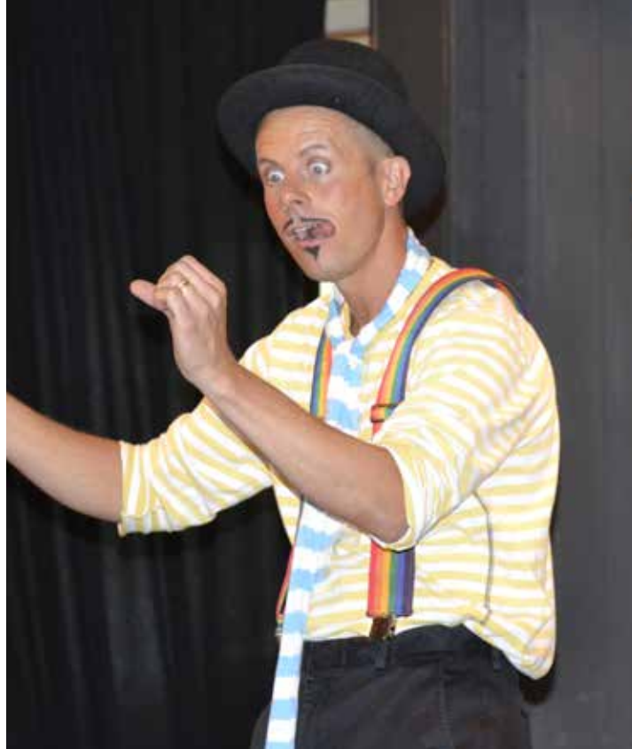
Text och foto: Marianne Lundqvist

Godisregn och ansiktsmålning var andra aktiviteter under dagen.