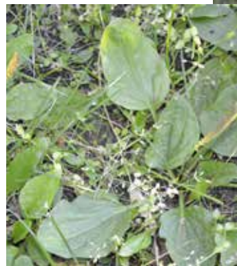
Grobladen har en läkande effekt på sårskador

Kirskålen är en avskydd växt i våra trädgårdar, men är en verklig nyttoväxt ur medicinsk synpunkt. Bra mot både