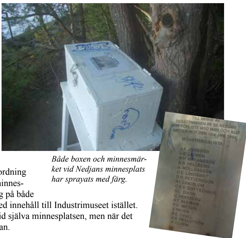
Både boxen och minnesmärket vid Nedjans minnesplats har sprayats med färg.

– Det hade så klart varit trevligare att haft allt samlat vid själva minnesplatsen, men när det inte får stå ifred, så går det ju inte, säger en besviken Pillan.