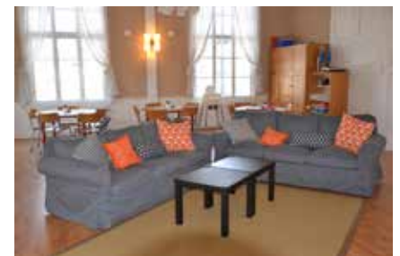
Lilla salen har iordningsställt för församlingens barnverksamhet