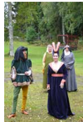
Medeltida kläder i olika utformningar visades under dagen.