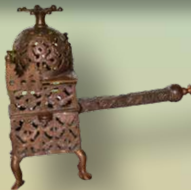
Bara tre exemplar i världen finns av den unika glödpannan från 900-talet och ett hittades i Hamrånge 1943