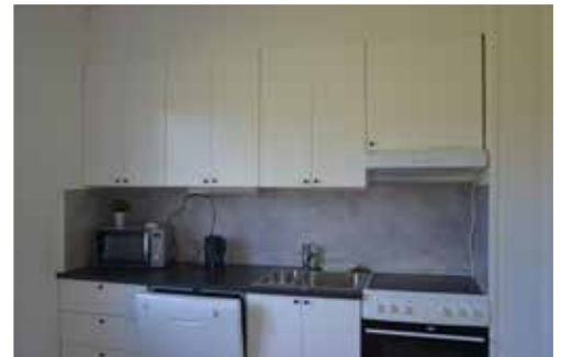
Köken helrenoveras och får vita eller grå skåpluckor