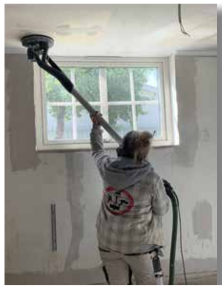
Teknik och rätt redskap är förutsättningen för att göra ett fullgott jobb