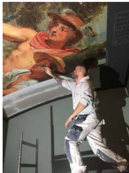
Tapetsering av valvat tak är bara ett av alla uppdrag som Pettas Måleri åtagit sig

– Det är också ett led i utvecklingen av mitt företag, säger Petta.