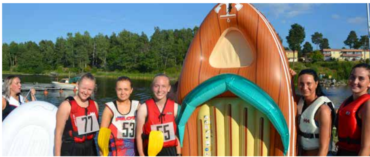
Norrhams tjejer och Norrhams damlag var två av teamen som deltog